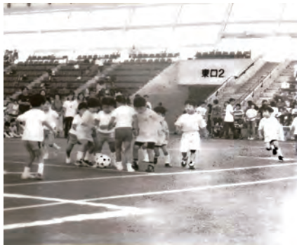
1997年 スーパーキッズサッカー