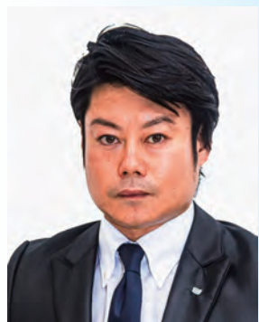
公益社団法人日本青年会議所 東海地区協議会