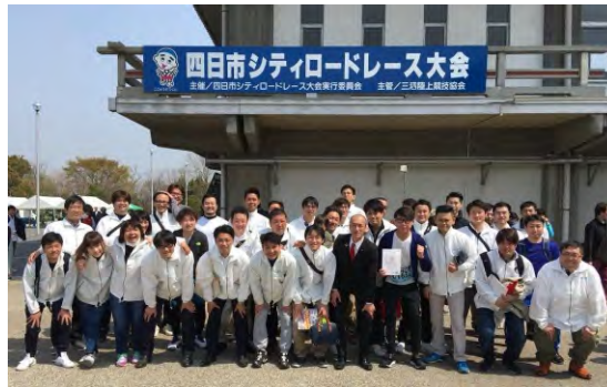
2019年 四日市シティロードレース