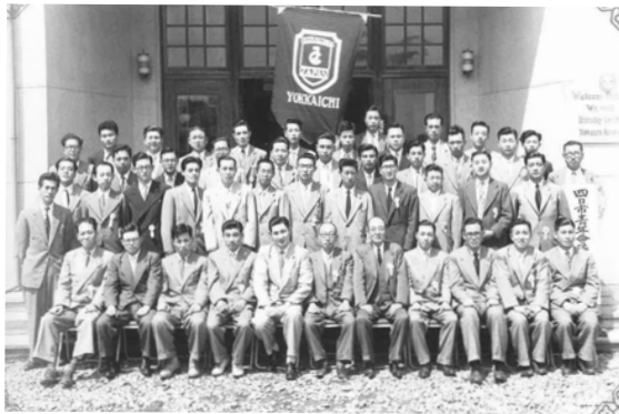
1955年創立時 チャーターメンバー集合写真