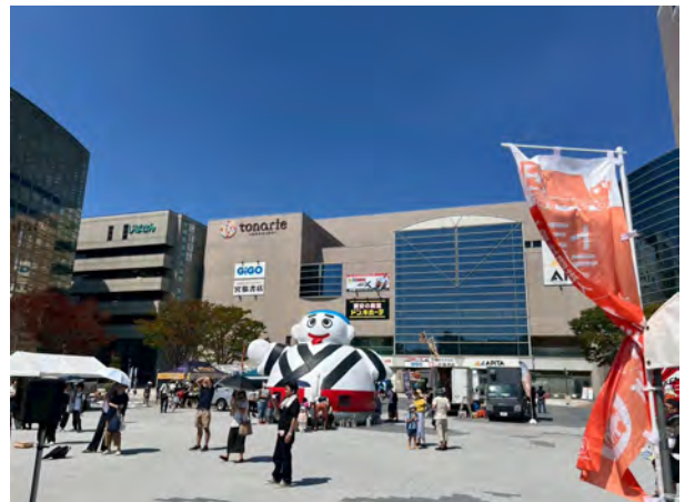
四日市市民公園での開催の様子