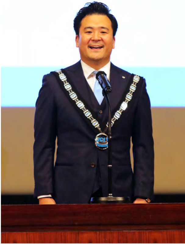
仲野理事長による力強いご挨拶