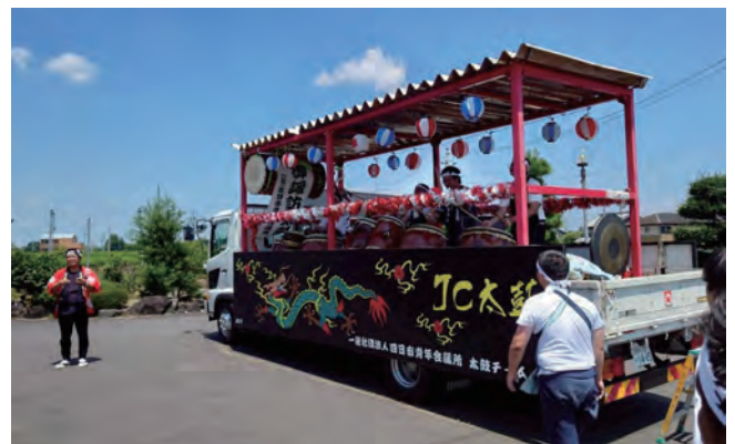
2025年 青年会議所と共に育ち 60周年を向かえた青年会議所太鼓チーム