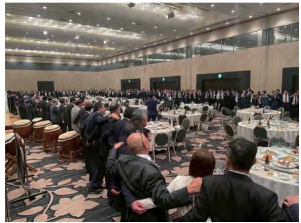
参加者全員で「明日のために」合唱

2025 年 5 月 15 日に創立 70 周年記念式典及び祝賀会を開催させていただきました。