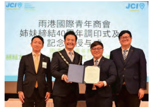
2025年 雨港国際青年商會 姉妹締結40周年調印式