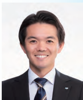
公益社団法人日本青年会議所 東海地区協議会