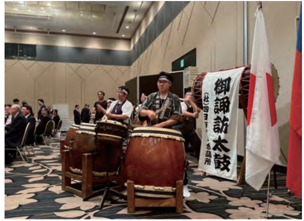
太鼓チーム生演奏