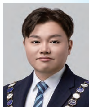
雨港国際青年商會 會長