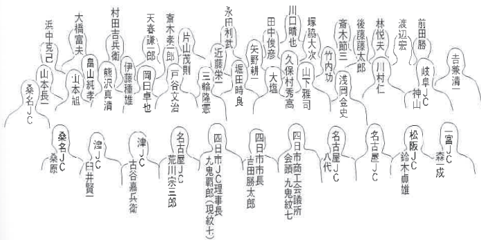
1955年創立時 集合写真撮影時 氏名一覧