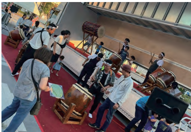
太鼓チームと共に太鼓の演奏体験