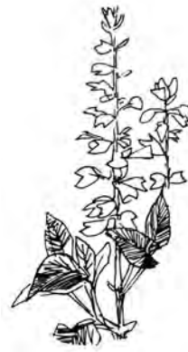
1981年設立当初 サルビア基金シンボルマーク 「サルビアの花」