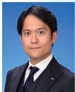
公益社団法人名古屋青年会議所 第 75 代 理事長